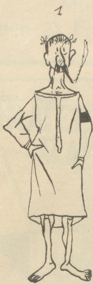
Als: Brutus um Cäsar trauernd Nachthemd mit Trauerrand und Epheuranke.