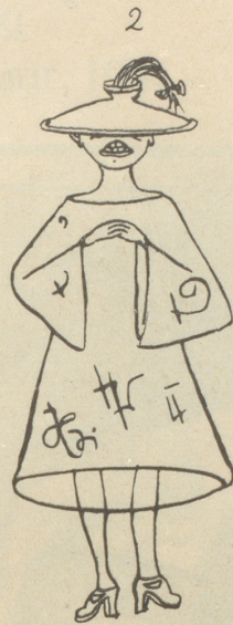
Als: Ma Jong Lampenschirm und bemaltes Hemd.