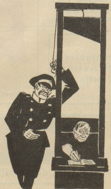
Wie sich Pilsudski seinen Parlamentarismus vorstellt!