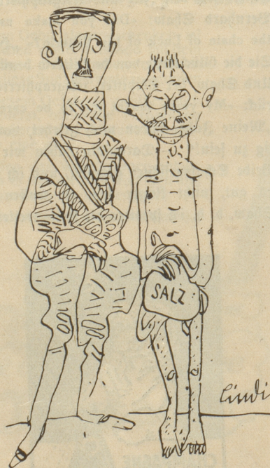
Gandhi und der Vizekönig von Indien

Maschinenschrift. Original italienisch. Die Kette darf in keinem Lande aufgehakt werden. Sie hat am 3. März 1930 begonnen. Bisher kursierte sie in Italien, Frankreich, England, Deutschland, Schweden, Finnland, Norwegen, Amerika, Schweiz. Sie soll in sieben Jahren neun Mal