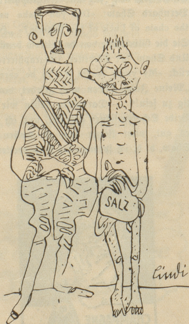
Gandhi und der Vizekönig von Indien

Maschinenschrift. Original italienisch. Die Kette darf in keinem Lande aufgehakt werden. Sie hat am 3. März 1930 begonnen. Bisher kursierte sie in Italien, Frankreich, England, Deutschland, Schweden, Finnland, Norwegen, Amerika, Schweiz. Sie soll in sieben Jahren neun Mal