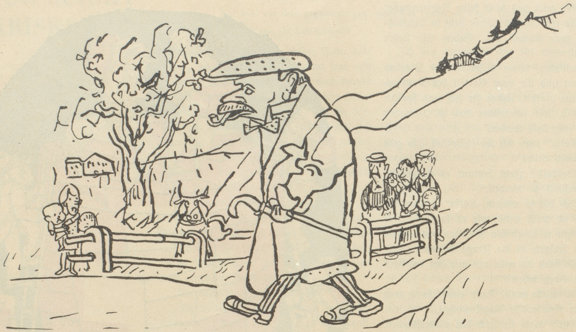
Der erste Kurgast.