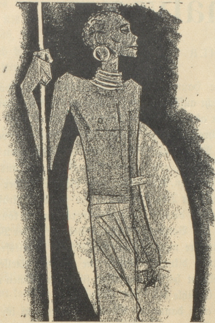
1. Der Zulu trägt keine SUN , weil er sie nicht braucht.