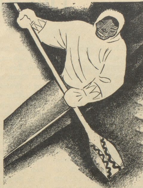
2. Der Eskimo trägt keine SUN , weil er sie nicht kennt.