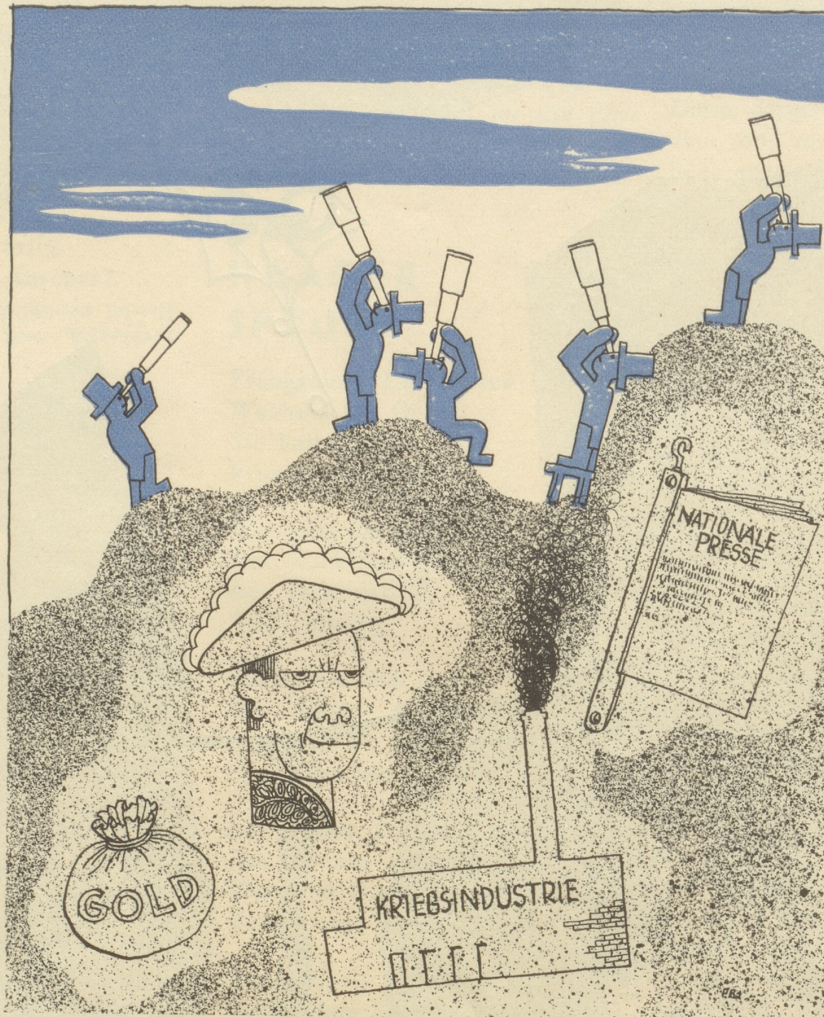
In Genf findet man keine „Angriffswaffen“

Abends spät muss ich einem Nachbar ein Telephon ausrichten. Der gute Mann jammert, dass man ihn noch aus dem Bett geholt habe. Die Frau liest mir vom Gesicht, dass ich ihm nicht glaube und sagt: «Es stimmt schon, was mein Mann sagt, wissen Sie, mein Mann trägt den Kragen und die Kravatte auch im Bett, denn er sagt, wenn das Haus brennen würde oder ein Erdbeben käme, so hätte man sicher keine Zeit, sich fertig zu machen.»