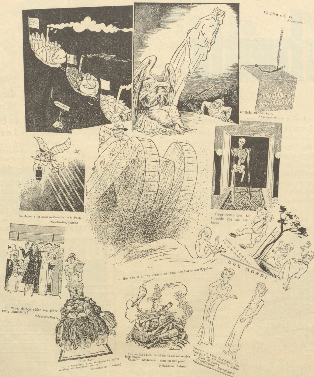
Le Japon a lui aussi sa Colombe de la Paix. (Nebelspalter, Suisse.)