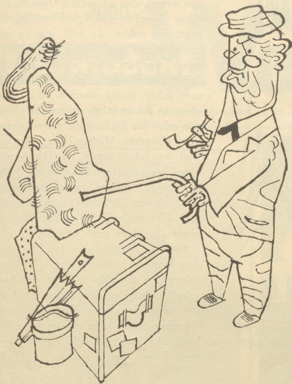
Lue — lue — was für en schöne Ärdäl — —