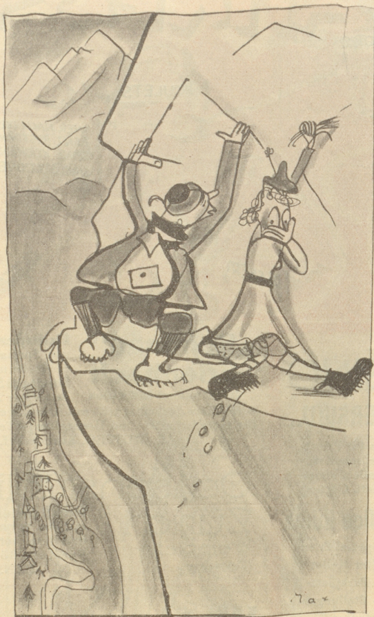
„Zu Fuß mach ich sowas nicht mehr, Kurt!“