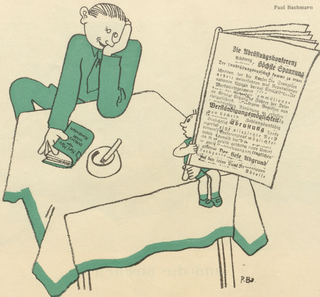
„Du, Vatter, was ischt eigentli i dr Zytig gschtande, wo kei Völkerbund gsi ischt?“