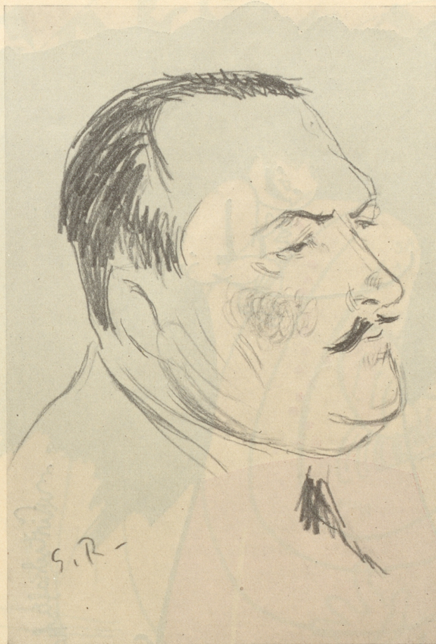
Schweizerische Politiker im Karikaturen-Spiegel des Nebelspalters: