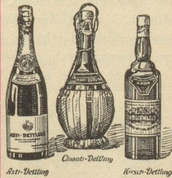
Asti-Dettling Chianti-Dettling Weiss-Dettling