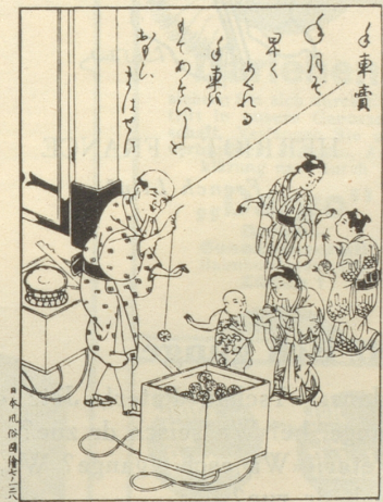
Der Vater des Yo-Yo

Japanische Tuschezeichnung aus dem 18. Jahrhundert.