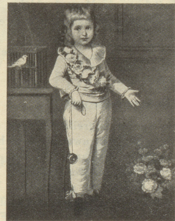
Portrait Louis XVII.

Japanische Tuschezeichnung aus dem 18. Jahrhundert.