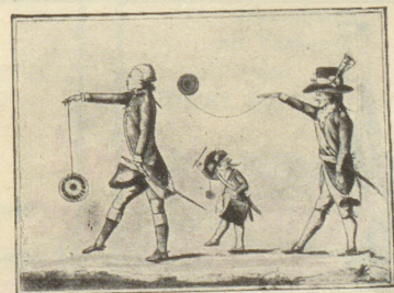
General Lafayette in der Karikatur