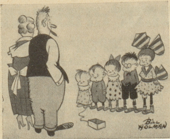
Auch ein Fünf-Jahre-Plan. (Lise)

Im Studentenalter ist «die Frau» in «solchen Sachen» dem jungen Mann gedanklich meist voraus und wenn sie Seitenwege betritt, um aus der eventuellen Not eine Tugend zu machen, geht sie meist nur darauf, um von da aus den Hauptweg besser im Auge zu behalten. Im selben Alter weichen «die Herren der Schöpfung» solchen Problemen oft noch aus, weil «man» zuerst Karriere machen muss. Wie sollte man denn der zukünftigen Dame des Herzens eine glückliche Liebe bieten, ohne vorher Karriere gemacht zu haben? (Vide oben.) Da