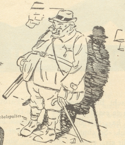
Häst och sparv 1933. Nebelspalter

— Vive Hitler! Monsieur! — Qu'est-ce que vous voulez que ça me foute. Je ne suis pas psychiatre. (Nebelspalter, Suisse.)