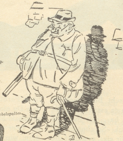
Häst och sparv 1933. Nebelspalter

— Vive Hitler! Monsieur! — Qu'est-ce que vous voulez que ça me foute. Je ne suis pas psychiatre. (Nebelspalter, Suisse.)