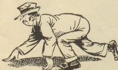
... wieder zum Vierfüsser.