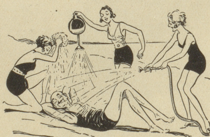
An allen Träumen ...