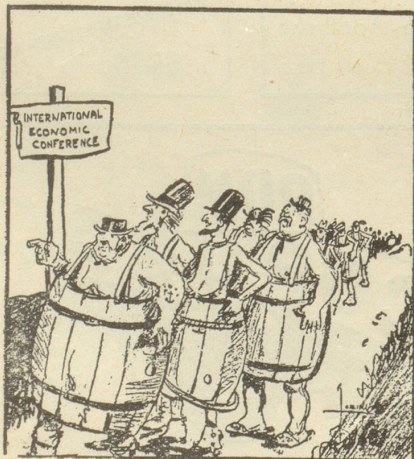
Der Marsch auf's Ziel (Man beachte die zweckmässige Ausrüstung) (Providence Bulletin)