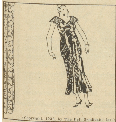
(Copyright, 1933, by The Bell Syndicate, Inc.)

«Nicht im geringsten; der Ring gehört meiner Frau.»