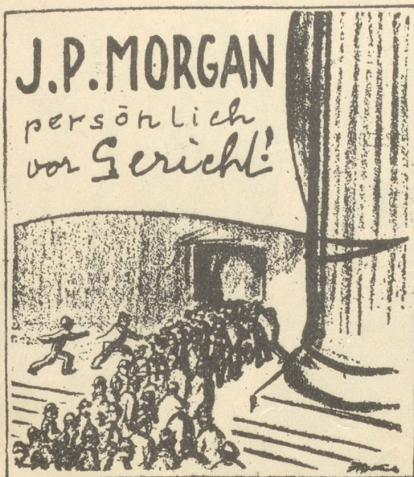
Die größte Sensation seit Barnum! (Saint Louis Post Dispatch)