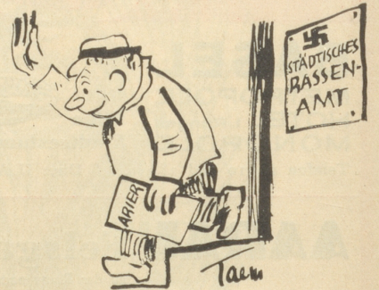
Heil! Ich kriege eine Stellung!