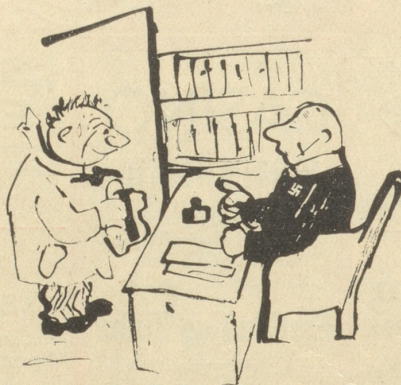
„Was wiegt mehr: Kilo Eisen oder Kilo Baumwolle?“ „Kilo Eisen!“ Sehr gut!“