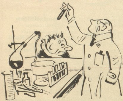
Blut stark nordisch-positiv (++++)