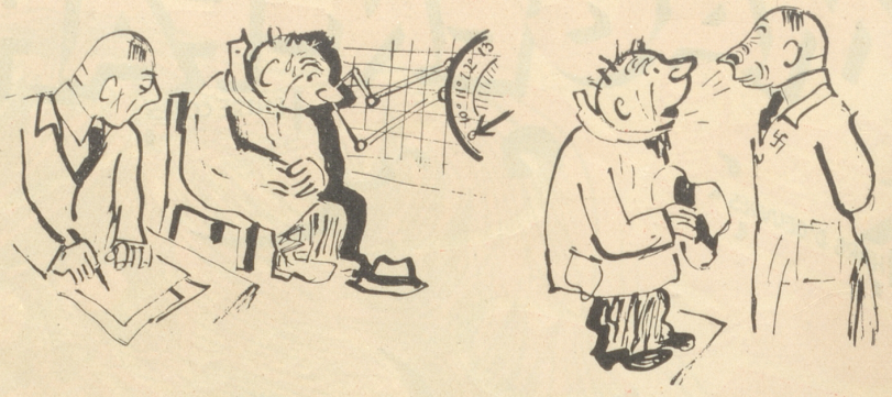
Nase arisch (Nasenkurve 9,04, L13/0,65) Mundgeruch: knoblauchfrei!

Um unsere Leser mit den Untersuchungsmethoden der Rassenämter bekannt zu machen, haben wir unseren Berliner Mitarbeiter Taem beauftragt, ein solches Rassenamt zu besuchen und eine Bildreportage zu machen. Die Redaktion.