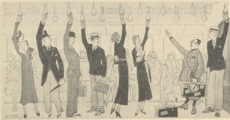
Der Mann vom „Nazi-Land“ ist entzückt über seinen Empfang auf der Londoner Untergrundbahn.