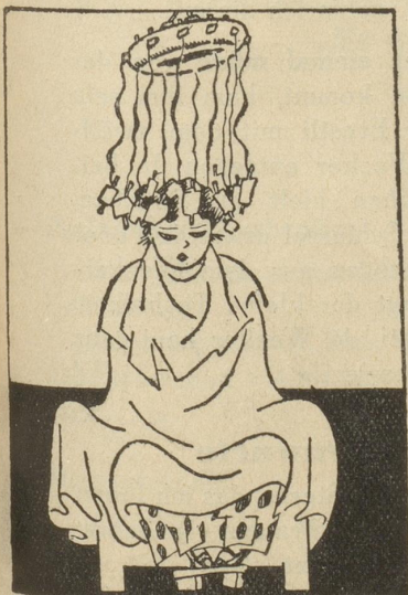
Fakir in Europa

Die Frau, die die Wahrheit sagte, sieht ihn hocheerstaunt an. Er lacht vergnügt. Da zuckt sie die Achseln und wendet sich ab.