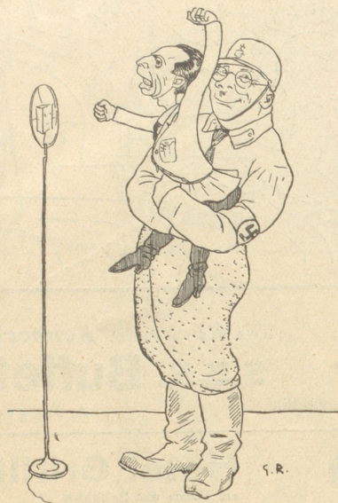
Nebelspalter Nr. 36