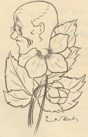
ADATCI . JAPAN „Japanese Anemone“