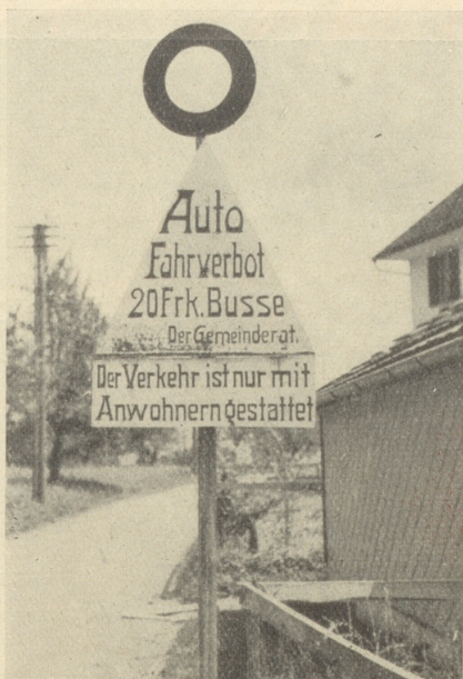
Ein Bildchen aus der Gemeinde Wollerau

— Wo hab i jetzt mei linker Glacéhansche? Die hab i von meim Breiticham. Der is Truppführer bei die Nazi. Wisse Se, des sind noch andere Leit, als die, die, die Schweizer in Zirich. Die miserable Viehcher habe mi rausgeschmis. Wisse Se, Sie dirfe nix Beeses denke vommir. Des war so: Mei Breiticham, der wo Truppführer is bei die Nazi, der hat mir jede Woch geschriebe und hat mer e Bild vom Fihrer geschickt. Nu hab ich da