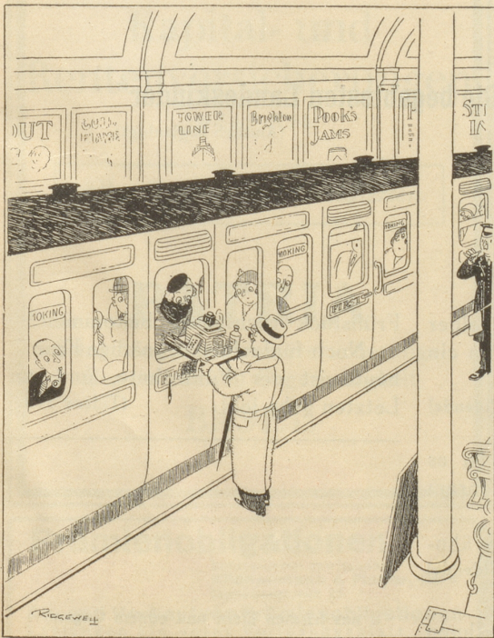
„... und vergiss nicht zu schreiben, Schatzi!“ (Humorist)