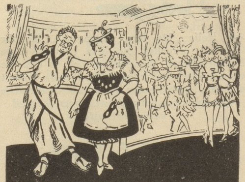
Nach der Demaskierung.

„Woran hast Du mich eigentlich unter dieser Grieden-Maske erkannt?“ „Nur an Deinen Hühneraugen! Warum hast Du die nicht längst mit „LEBEWOHL“* weggebracht?“