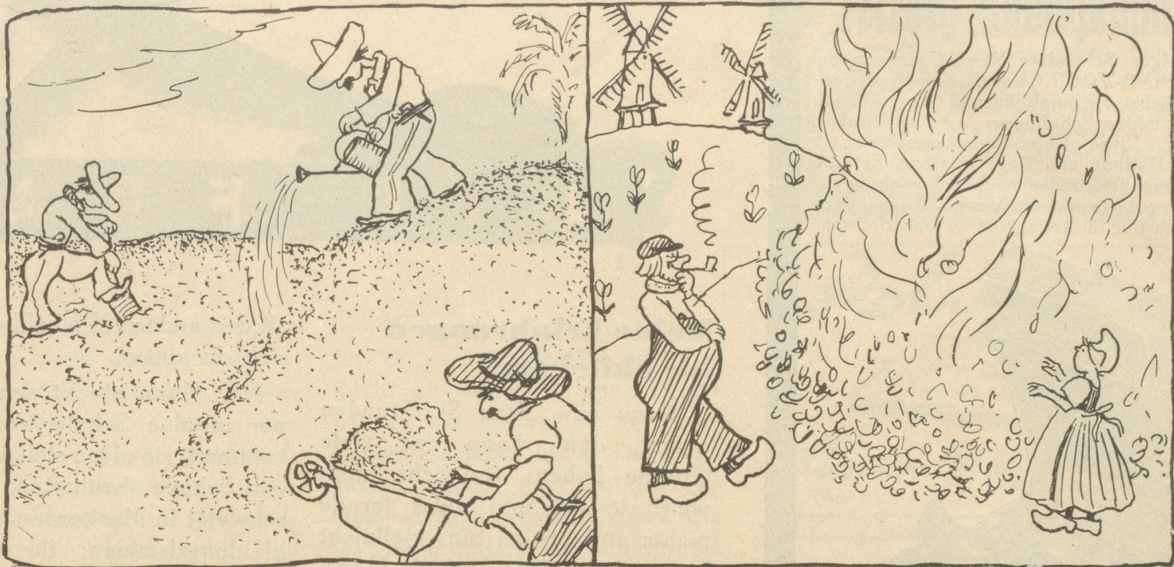
verbrennt man in Mexiko Kaffee,