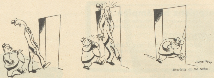
(Storrella dt De Setu).