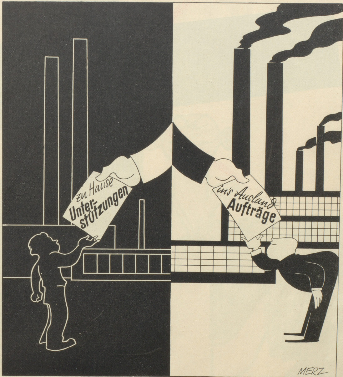
Die Stadt Zürich hat für ihre Feuerwehr zwei amerikanische Wagen und für die Elektrizitätsversorgung einen französischen Lastwagen gekauft. Die Fahrzeuge hätten in mindestens ebensoguter Qualität von Schweizer Fabriken geliefert werden können.

Kind erfreute, gestand ich ihr schmeichelnd, dass zwei Herren in unserer Pension direkt in sie verliebt seien. Man sollte sich zwar nie in fremde Verhältnisse mischen! Aber das gute Kind frug mich treuherzig: «Ja, wer ist denn der andere?» Posch