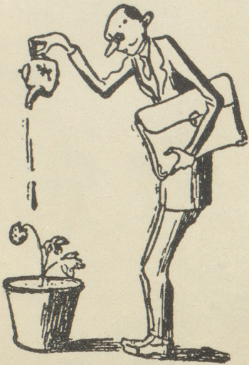
Wie man sich an massgebender Stelle die Erdbeerkultur vorstellt. (Krokodil)