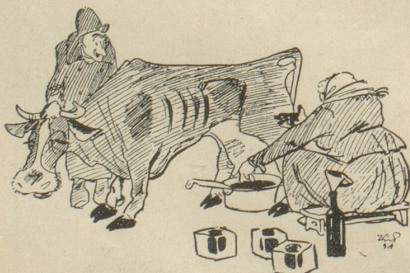
«Seit drei Jahren wird das Vieh nur noch mit Verordnungen gefüttert — und jetzt gibt es richtig Tinte statt Milch!» (Krokodil.)