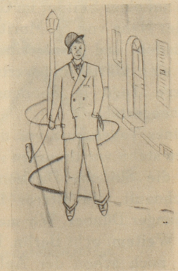
Idee und Zeichnung von Th. Friedr. Dürst, Wesen

„Ga... gar nicht... hupp... so blöd, daß die Geträ... tränke auch endlich gesteuert werden. Erstens eine technische Nehu... Neuerung und zweitens brauch ich nur noch halb so weit nach Hause zu gehen!“