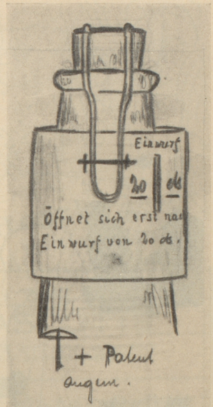
Idee und Zeichnung von A. Tribelhorn, Zürich

Heute ist Tschümperli Inlandredaktor an einem führenden Blatte, Mitglied des Nationalrates und soll demnächst den «doctor honoris causa» einer schweizerischen Universität erhalten. Natus