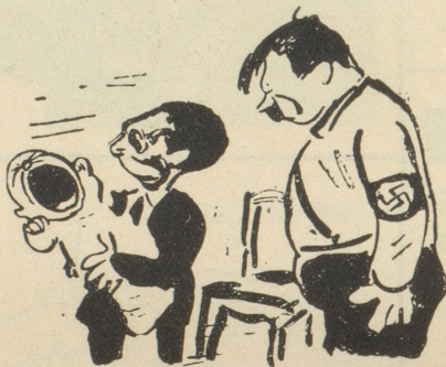
„Mein lieber Göbbels ... ich glaube bald, das Kind ist doch von Dir!“