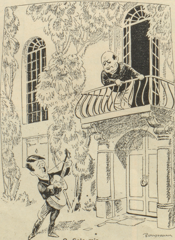
O, Sole mio .....