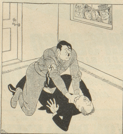
Arier unter sich

Glosse aus „De Groene Amsterdamer“, Holland