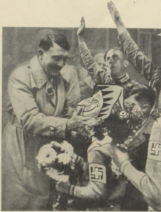
Ein Witz wird Wahrheit Der Nebelspalter begrüsst seinen neuen Führer

Am 8. September 1933 brachten wir dieses Bild als Witz. Wir ahnten damals nicht, wie bald es Wahrheit werden würde.