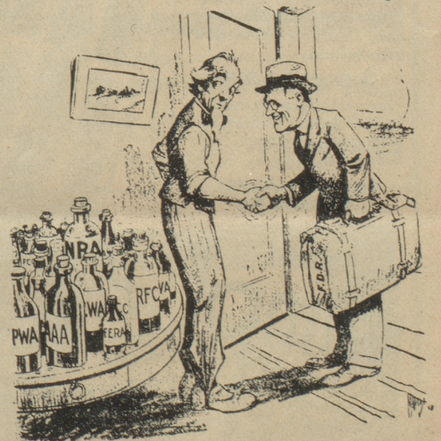
Roosevelt geht in die Ferien „... und vergiss nicht, recht fleissig von der Medizin zu nehmen ...“ New Yorker