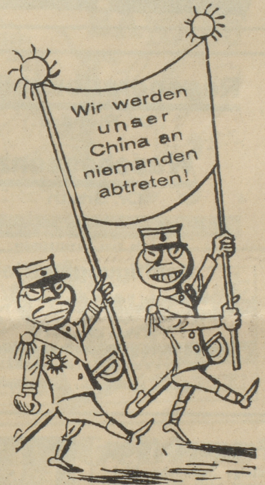
Japanischer Patriotismus Vetcherniaia, Moskau