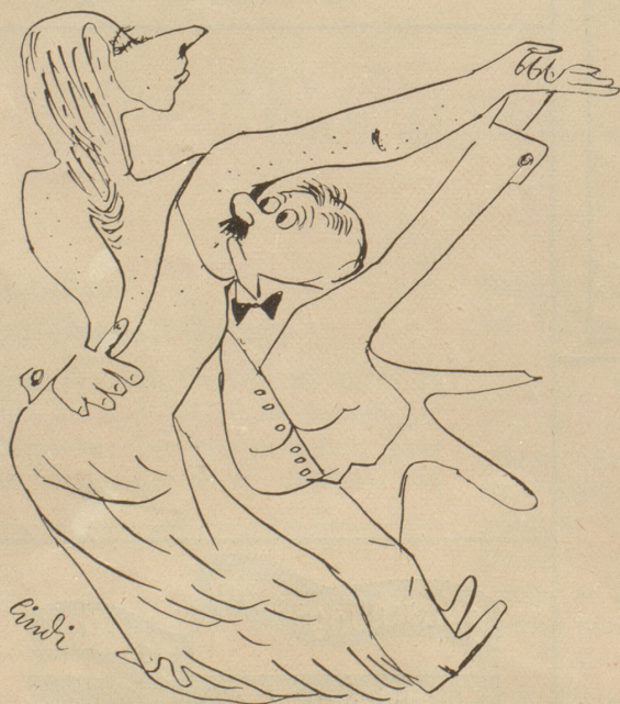
Der Mann und die andere Frau: