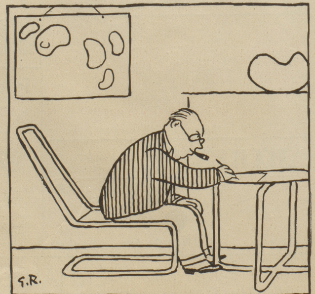
Nein, ein surrealistisches Gemälde!