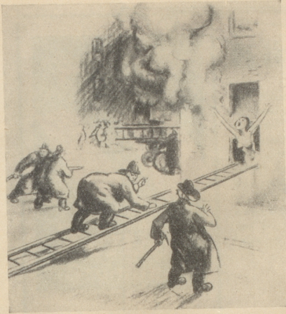
Die Dame, die unbedingt mit der grossen Leiter gerettet werden wollte. Bally Hoo