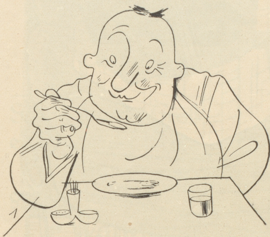
Das isch jetz öppis Feins!