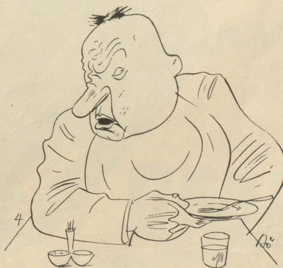
Han i miner Läbtig na nie möge! Abfahre!