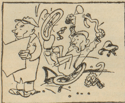
Russisches Fahrrad Eine Glosse auf die Qualität der russischen Erzeugnisse. Krokodil, Moskau