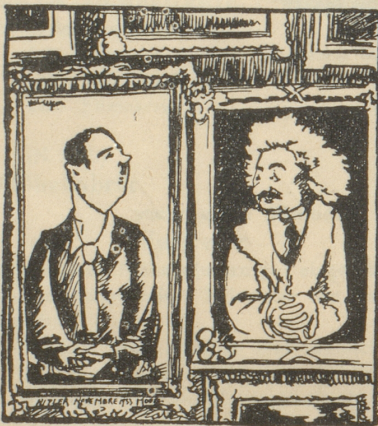
Auf der Ausstellung der Royal-Society in London hängen Hitler und Einstein freundlich nebeneinander.