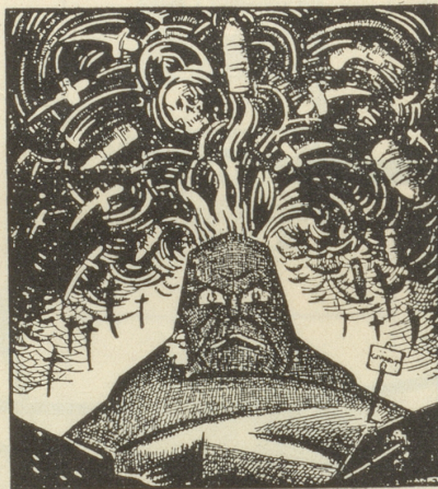
Der Vulkan Notenkraker, Amsterdam