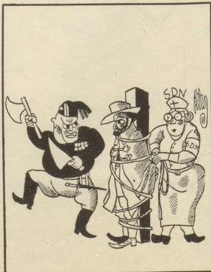
Zivilisation Le Canard, Paris

Wir Psychiater erklären, dass unsere Wissenschaft heute sehr wohl imstande ist, wirkliche, vorgeschobene und unbewusste Motive unterscheiden zu können, auch bei Staatsmännern.