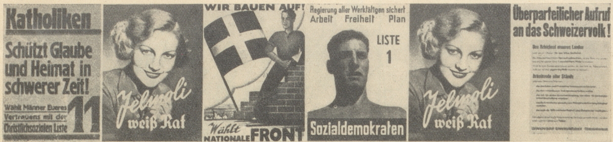
Also warum wurde dann nicht eine unabhängige Liste Jelmoli aufgestellt?