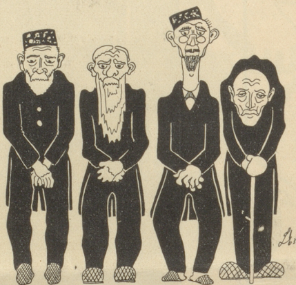
Kommission zum Studium der Subventionierung zur Verhinderung des Geburtenrückganges