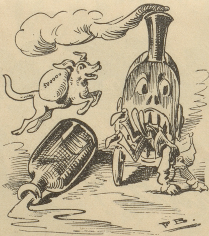
Wenn der Hund mit dem Geld über'n Schnaps wegspringt Und die Bahn das Volk und den Bund verschlingt.