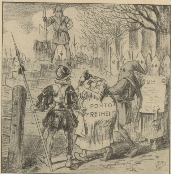
Ein Todesurteil, das nie gefällt wird