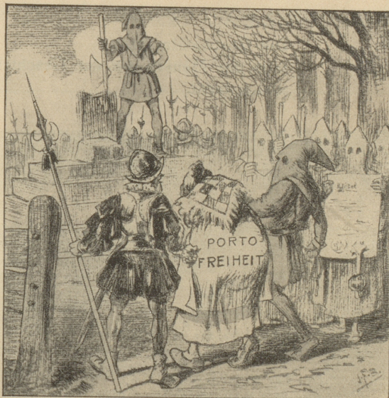
Ein Todesurteil, das nie gefällt wird