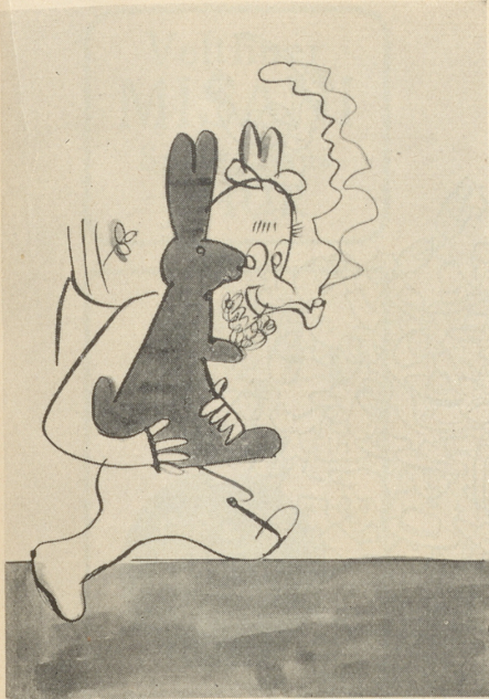
— — — Für d's Friedali!!!!