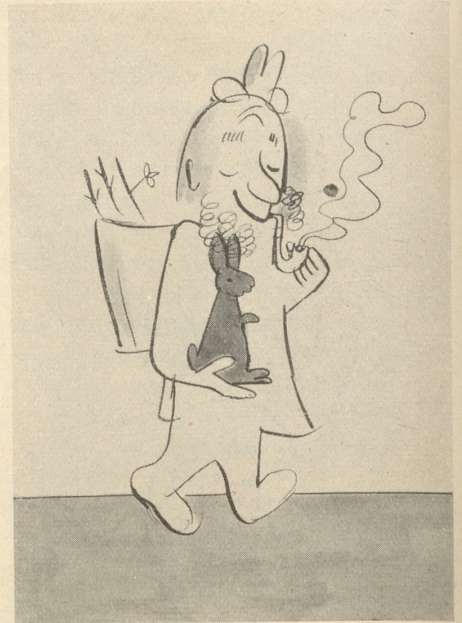
— — Für d's Friedali!!!

war dieser eben erst durch den Lärm erwacht. Vor dem Abteil ballte sich die Menge und darunter befand sich auch das Siegerantlitz des Meister Sombrero.