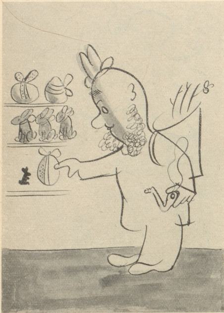
As Häsi für d's Friedali! Das verman i!