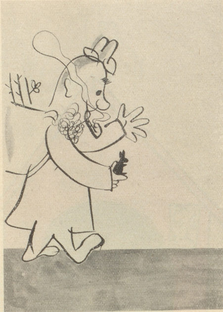
— Für d's Friedali!!