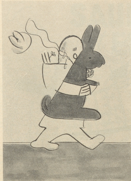
— — — — Für d's F.....!!!!