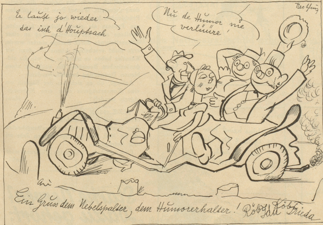
Nach dem Absturz