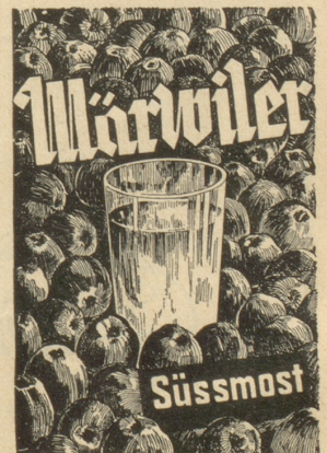
Das ist Qualität